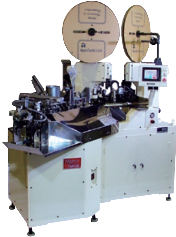
※写真には、オプションが装着されています。